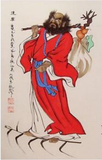
Đạt Ma cỡi lau vượt sông Dương Tử