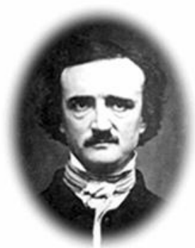
Edgar Allan Poe