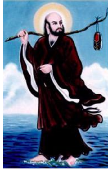
Đạt Ma quảy chiếc giày trên núi Thống Lĩnh